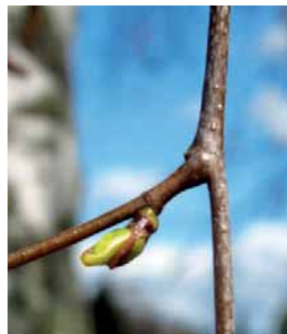
Abb. 4 Mittel zur Ausleitung und Entgiftung: die Knospen der Hängebirke.

Dieser Artikel ist online zu finden unter: http://dx.doi.org/10.1055/s-0033-1349727