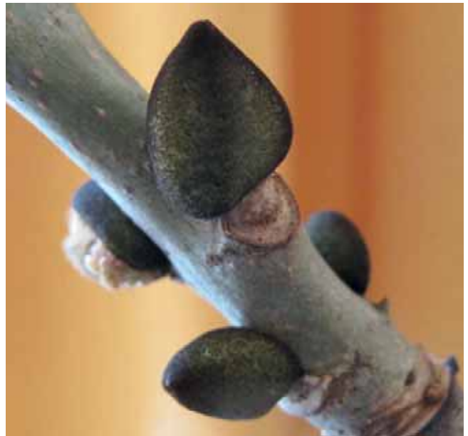
Abb. 2+3 Die schwarzen Knospen der Steinsche sind unverwechselbar.

Man kann bei Bedarf auch 2–3 Präparate miteinander kombinieren, dann aber zeitlich getrennt, z. B. morgens und abends.