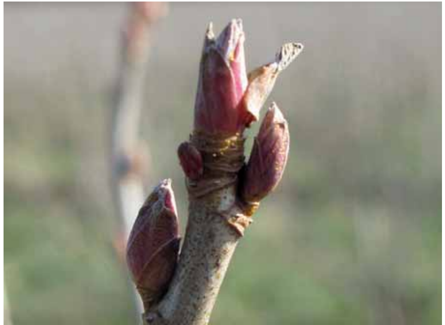
Abb. 1 Die Gemmotherapie nutzt die Heilkraft von Knospen. Das wohl bekannteste Gemmomittel ist Ribes nigrum (Schwarze Johannisbeere).

Im Einsatz von Heilmitteln aus Pflanzenknospen mit ihrem großen Teilungs- und Wachstumspotenzial und ihrem hohen Anteil an Aminosäuren und Prote-